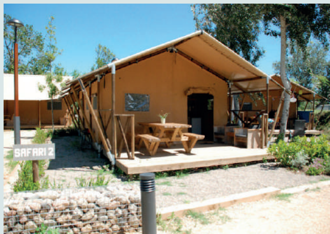
Camping Aquarius (St. Pere Pescador 2km)

Precio medio: consultar tarifa en la web. Depende de la temporada. Nº de habitaciones: 7 bungalows.