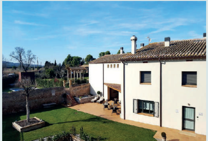
Mas Palol (Viladamat 6,3 km)