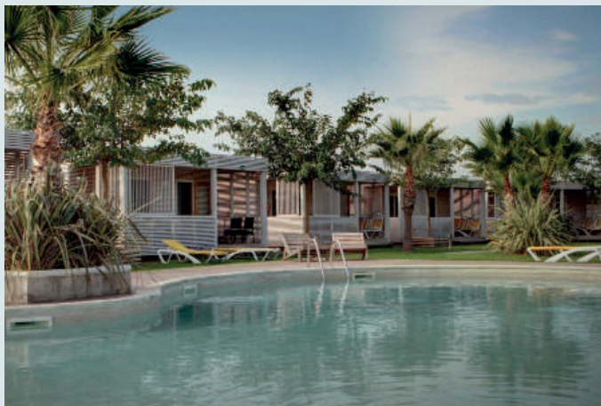
La Ballena Alegre (St. Pere Pescador 2km)

Precio medio: consultar tarifa en la web. Depende de la temporada. Nº de habitaciones: 336 bungalows.