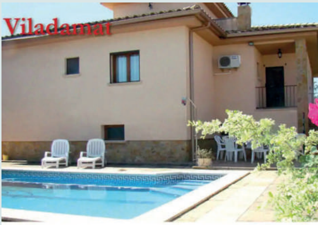
Casa Irene & Olga UGT (Viladamat 6,3 km)